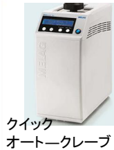
クイックオートクレーブ